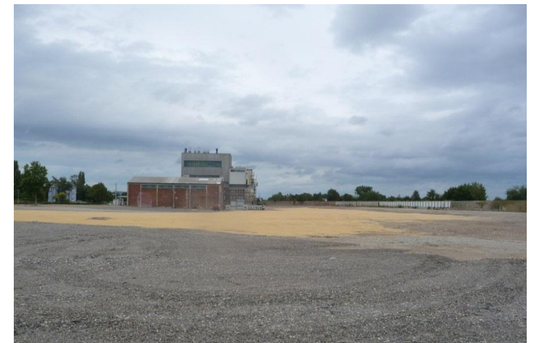
Das Gelände nach der Fertigstellung des Rückbaus, 2011