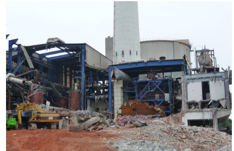
Selektiver Rückbau der Gebäude zur Zuckerfabrikation, 2009

Der Zuckerherstellungsprozess selbst führte zu keinen schädlichen Bodenveränderungen im Sinne des Bundes-Bodenschutzgesetzes (BBodSchG). Jedoch fand in den unterschiedlichen Betriebseinrichtungen (Werktankstellen, Tank- und Altöllager, Lokschuppen, Waschanlagen sowie Werkstätten und Hilfsstofflager) schweres und leichtes Heizöl Verwendung. Diese verursachten Bodenverunreinigungen durch Mineralölkohlenwasserstoffe (MKW), Polyzyklische Aromatische Kohlenwasserstoffe (PAK) sowie Schwer- und Halbmetalle. Bohrungen lokalisierten Auffüllungen aus Aschen, Schlacken und Erdaushub, welche jedoch keine Bodenveränderung nach dem BBodSchG mit nachteiligen Auswirkungen auf das Grundwasser darstellten.