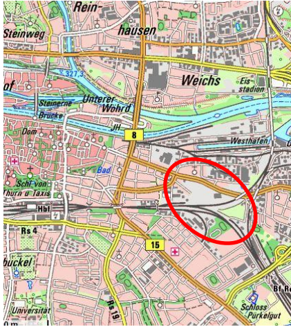
Lage in Regensburg