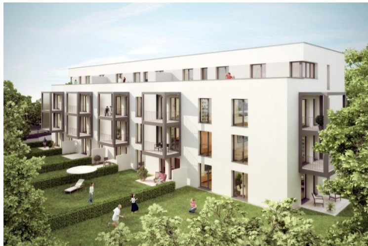
Computerbild einer Wohneinheit im Candispark

Das gesamte Sanierungsgelände wurde an einen Investor veräußert, welcher gemeinsam mit mehreren Projektpartnern den neuen Bebauungsplan der Stadt Regensburg umsetzt. So begannen kurz nach Abschluss der Rückbauarbeiten auf dem Gelände der ehemaligen Zuckerfabrik die Bauarbeiten für den „grünen Osten“, einem neu angelegten Stadtteil mit dem Namen „Candis“. Eine Mischung aus Wohnanlagen, Gewerbebetrieben, Einzelhandel und Ärztehäusern sowie einem Landschaftspark soll vor allem Senioren und jüngere Familien ansprechen.