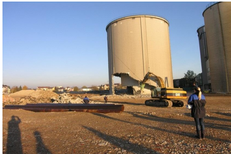
Vorbereitung zur Niederlegung des Lagersilos, 2010

Zum Abbruch der Hochsilos wurde, in Abstimmung mit dem Gewerbeaufsichtsamt und der Berufsgenossenschaft, das Verfahren des Einsturzes mittels Schwächung bzw. Unterhöhung der Bausubstanz auf Grundlage von statischen Berechnungen gewählt. Der Abbruchvorgang ähnelte hierbei dem Fällen eines Baumes.