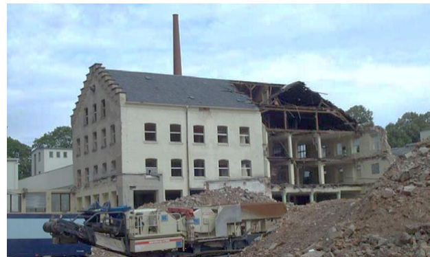
Abbruch von Gebäuden und Brennöfen mit mobiler Bauschutt aufbereitung