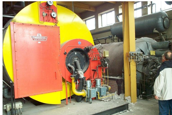
Blick in die Generatorenhalle