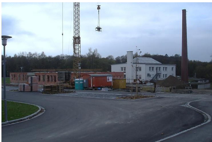
Neubau auf dem Gelände der ehemaligen Porzellanfabrik