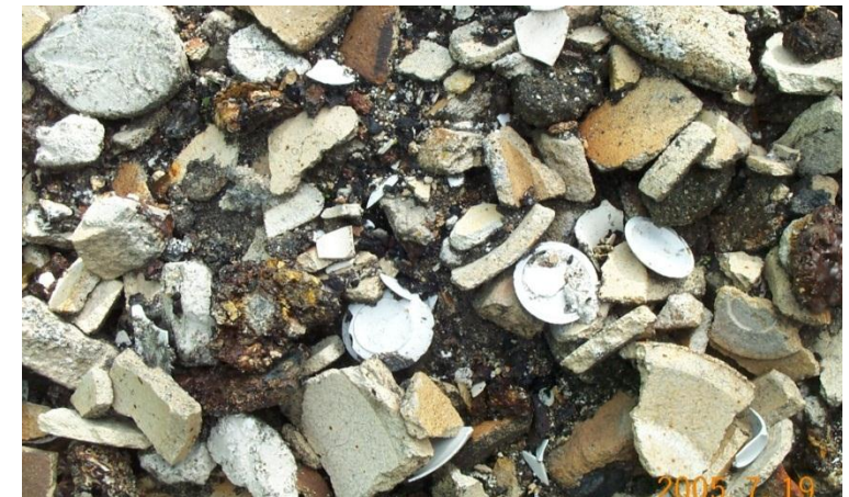
Haufwerk aus Scherbenbruch der ehem. Porzellanproduktion