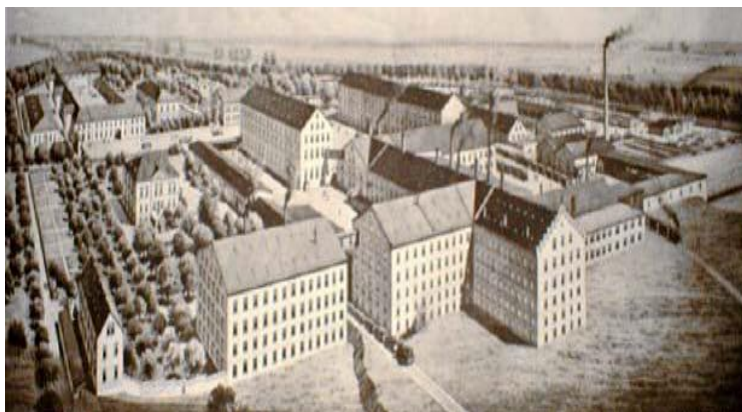
Historische Darstellung um 1900: Porzellanfabrik Ludwigsmühle in Selb

ca. 1,7 Mio. € (Planung, Abbruch und Bodensanierung)